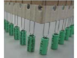
引线式铝电解电容

生産ライン及び設備の写真(設備の機種番号、出産メーカ、加工精度等について詳しく記入すること)