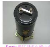
Screw 螺钉型铝电解电容